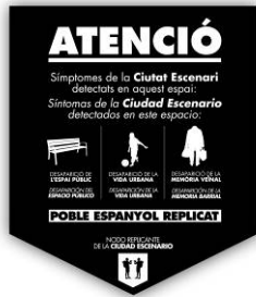
Left Hand Rotation, Nodo replicante de la ciudad escenario, 2016