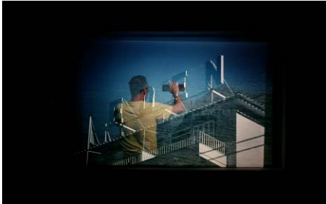
Juan Aizpitarte, Edén , 2016. © de la obra, Juan Aizpitarte, 2017