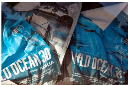
Ángela Bonadies, Barcelona, el verano sin fin , 2016. © de la obra, Ángela Bonadies, 2017