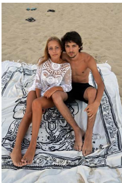
Miguel Trillo, Serie «Línea de costa», 2016 © de la obra, Miguel Trillo, 2016