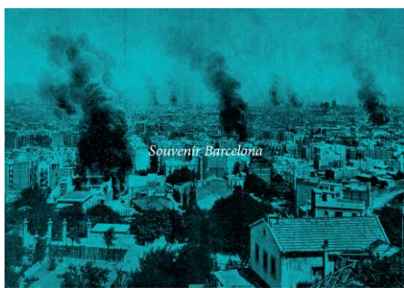
Domènec, Serie «Souvenir Barcelona», 2017, © de la obra, Domènec, 2017