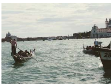
Irene Pittatore, Lavoratori del turismo , 2017 (fotograma del vídeo). © de la obra, Irene Pittatore, 2017