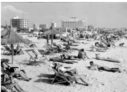
Marina Planas, Taxonomía del hotel balear , 2014